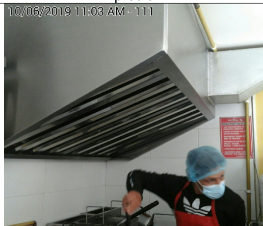
Fotografía N°. 4 Campana de las fuentes fijas de combustión.