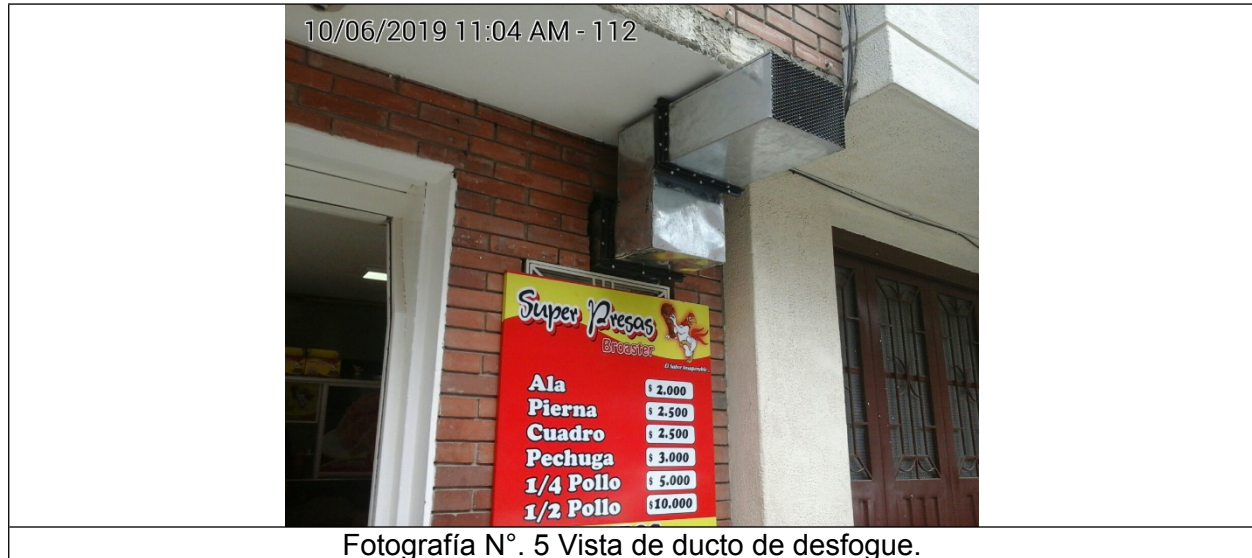
Fotografía N°. 5 Vista de ducto de desfogues.