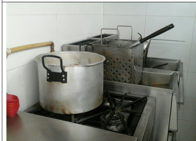
Fotografía N°. 3 Vista del área de cocción y freído.