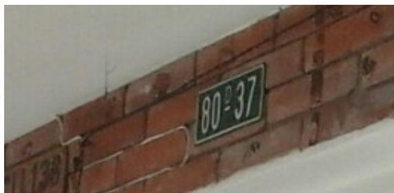
Fotografía N°. 2 Nomenclatura urbana del predio.