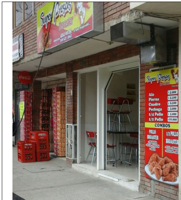
Fotografía N°. 1 Fachada del predio.